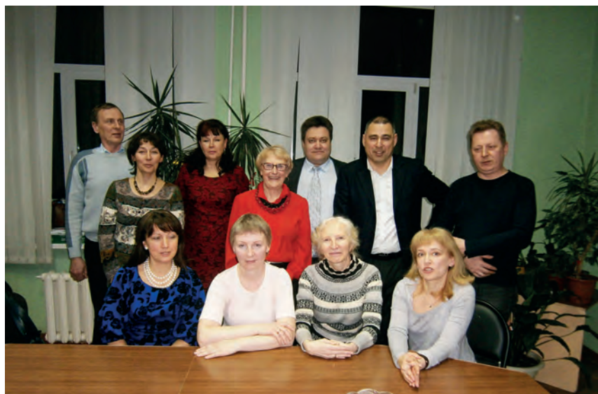
30 лет выпуску 1986 года (2016г.)