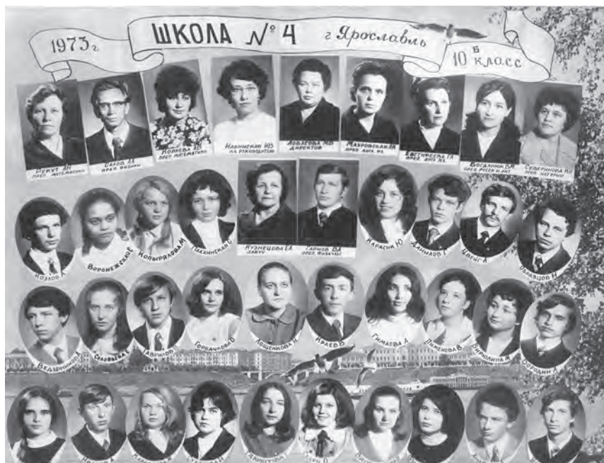
Выпуск 1973 года