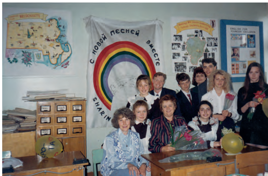
Выпуск 1993 года.