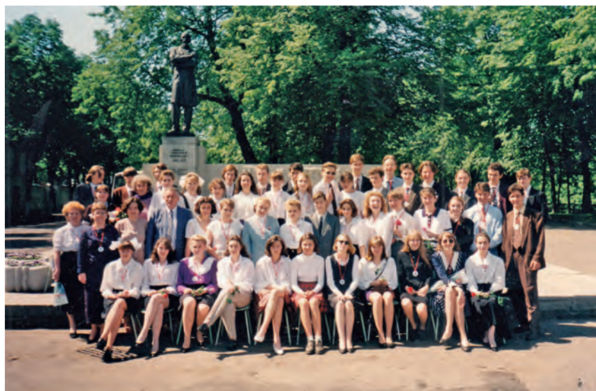
Выпуск 1995 года