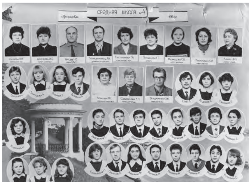
Выпуск 1986 года