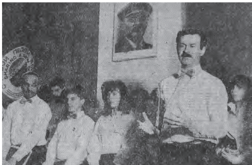
Американский хор из школы Линкольн Садберри в школе №4, 1988г.