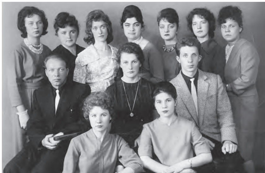
Группа в ЯГПИ, 1962 г.