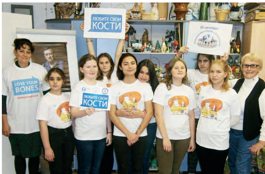
Мероприятие с детьми о здоровом образе жизни, детский дом «Солнечный», 2019г.