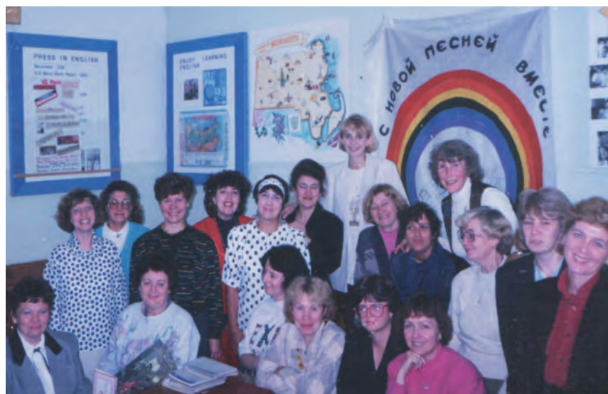
Методическое объединение учителей английского языка