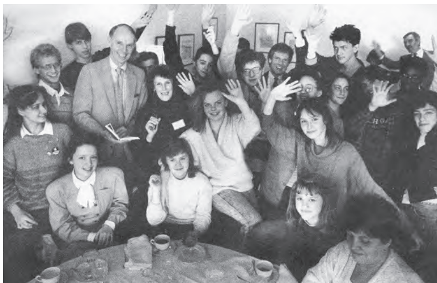
Дебаты российской группы учеников из школы №4 в Гарвардском университете, 1989г.