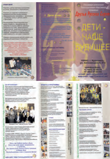
Буклет ЯРБОО «Друзья русских сирот» 2013 г.