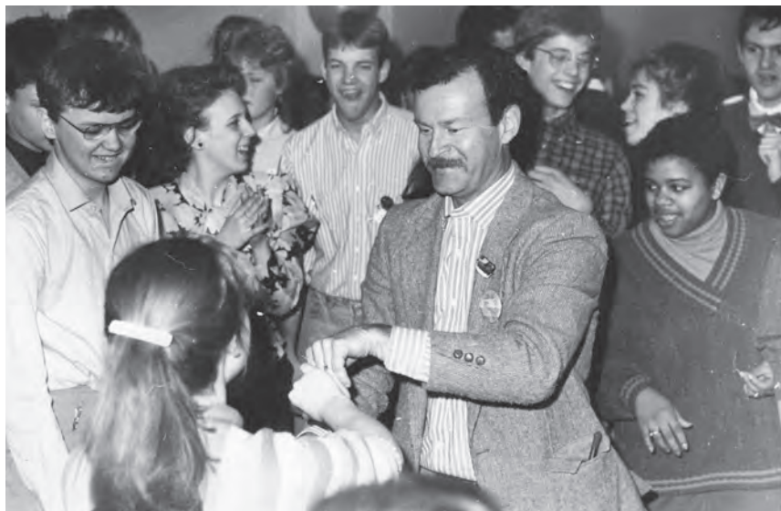
Первый визит американских учеников в ярославскую школу №4, 1988г.