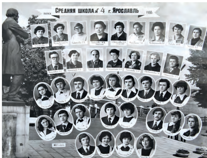
Выпуск 1980 года