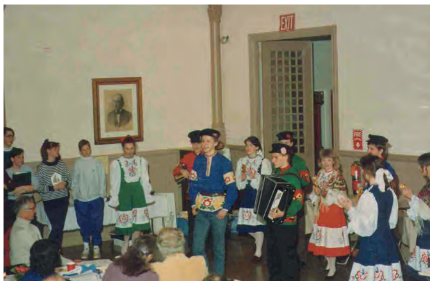
Ученики школы №4 выступают в США перед участниками хора «С новой песней вместе», 1992г.