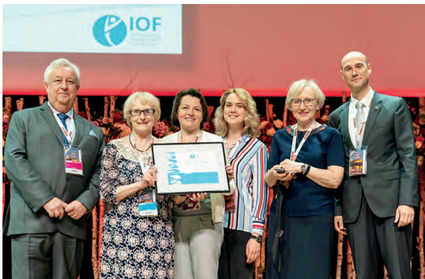
Диплом от Международного Фонда остеопороза обществу пациентов с остеопорозом «Остеорус» за Лучший модуль на конгрессе в Кракове (Польша), 2018г.