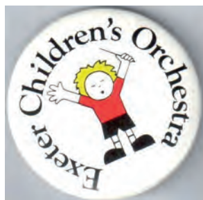
Логотип детского оркестра города Эксестера (Великобритания).