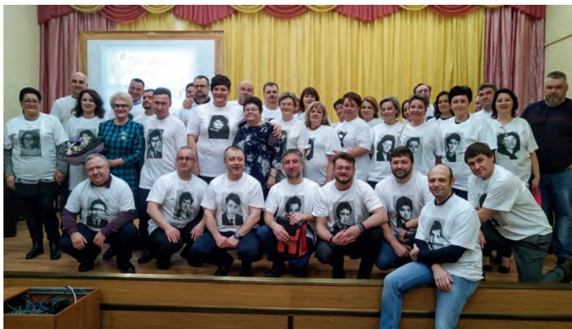
Вечер встречи с выпускниками в школе № 4 2020 г.