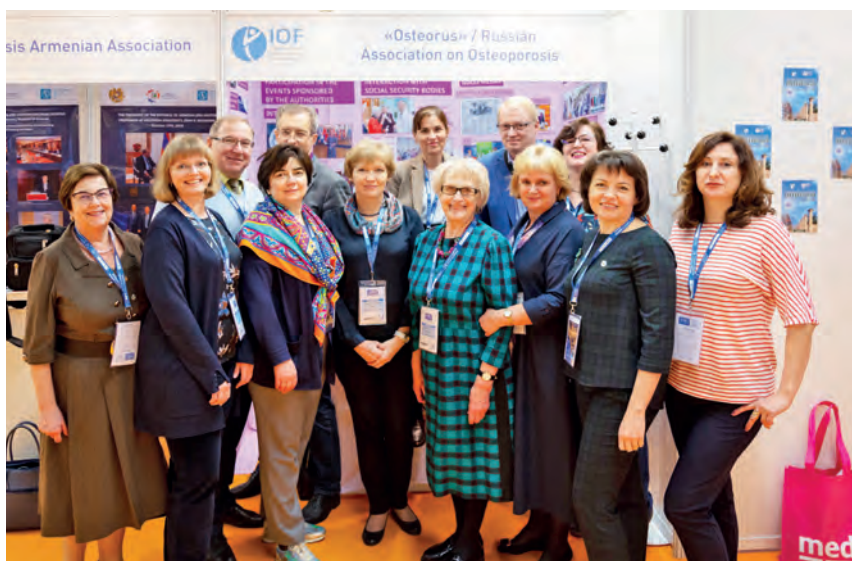
Международный конгресс по остеопорозу в Париже, 2019 год.