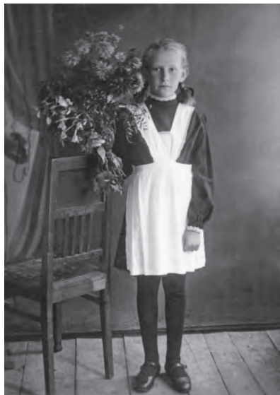
Первый раз в первый класс, 1947г.