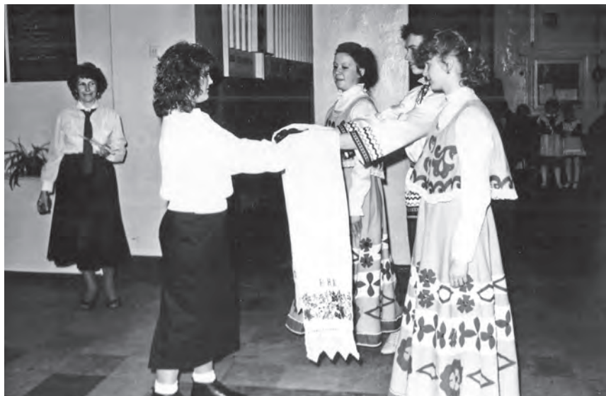
Встреча американских школьников в школе №4, 1988г.