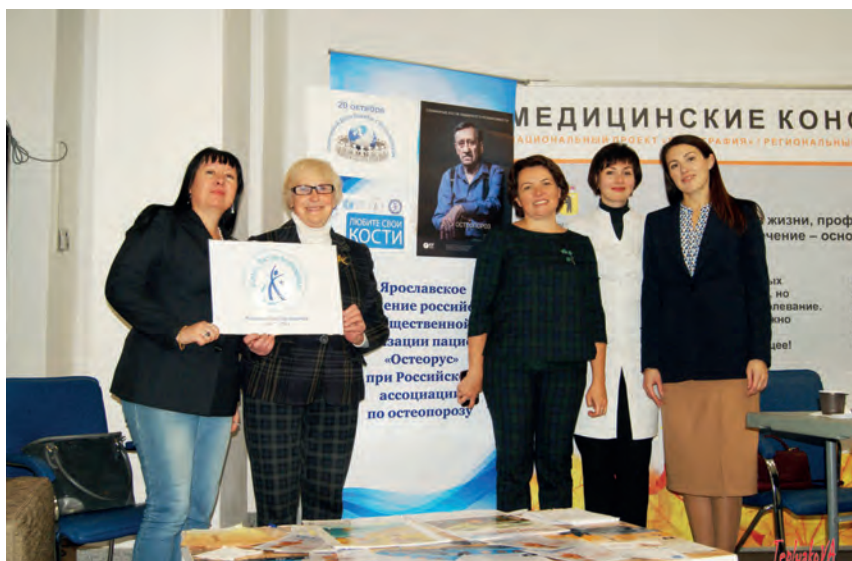
«Остеорус» и РАОП на Ярославском форуме, «Здоровье» 2019г.