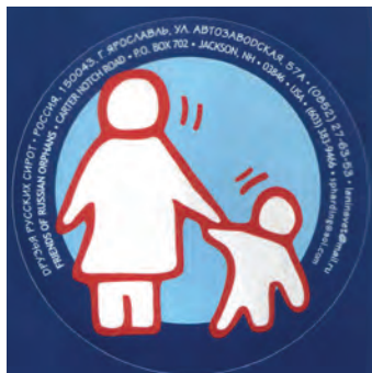
Логотип ЯРБОО «Друзья русских сирот»