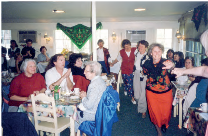
Праздник русских традиций в кафе «Ти Хаус»( Tea House) Вэнам, 1996 г.