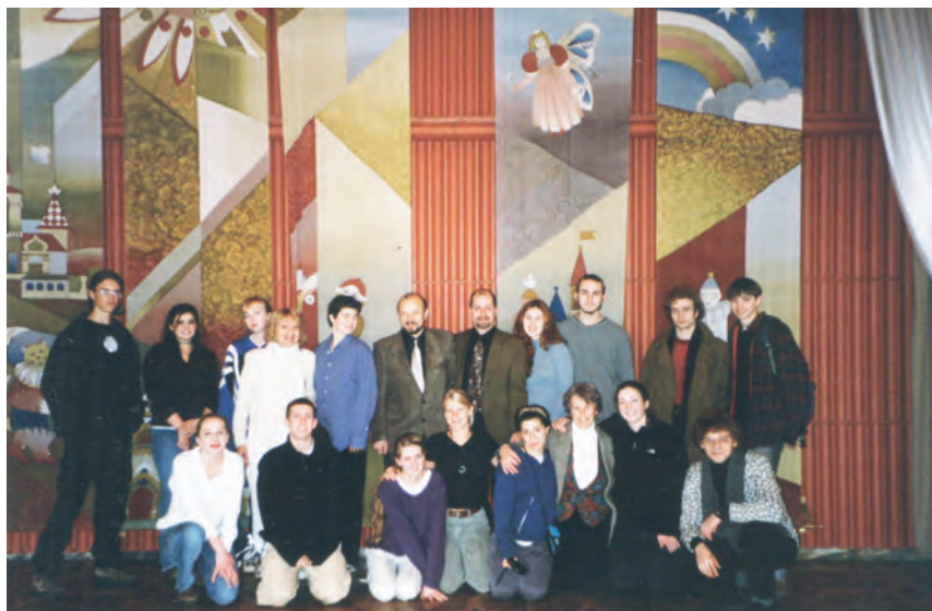
Участники театральной студии школы Хэмильтон Вэнам в ярославском ТЮЗе, 1998 г.