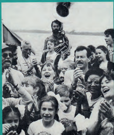
Буклет «С новой песней вместе»