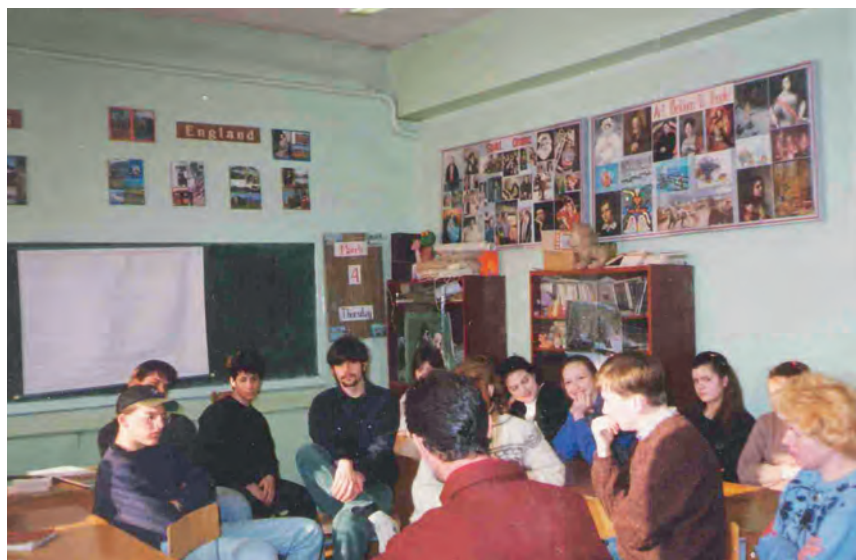
Американские школьники приехали в ярославскую школу №4, 1990г.