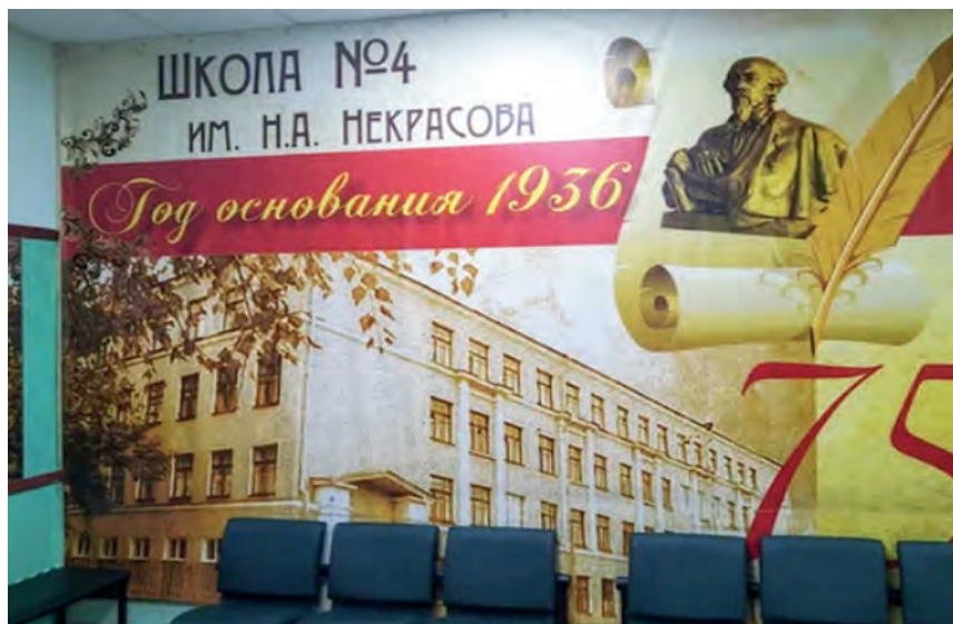
Школа № 4 им. Н. А. Некрасова