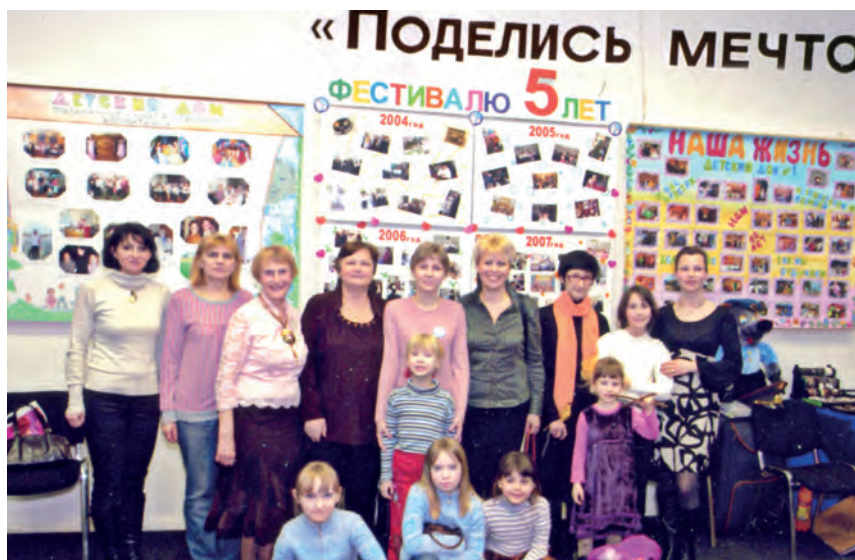
Фестиваль «Поделись мечтой», 2009 г.