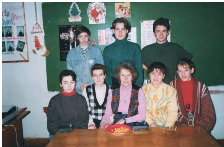
На уроке английского языка в школе №4. 1994 г.