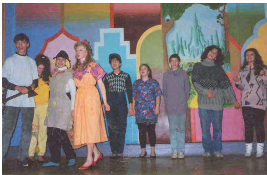
Мюзикл «Волшебник изумрудного города», 1994г.