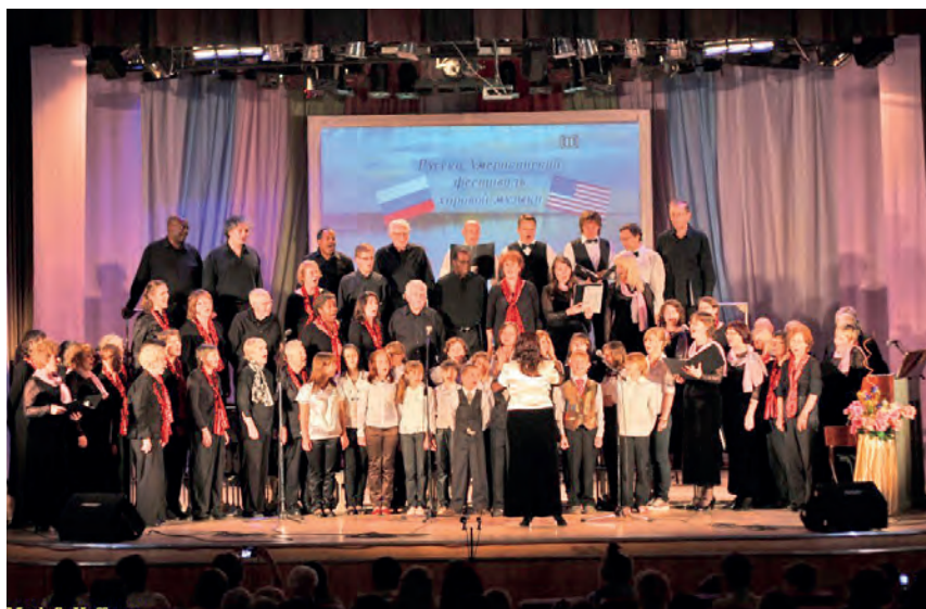
Фестиваль хоровой музыки: Американский хор «С Новой песней вместе» и сводный хор детских домов г.Ярославля в ДК «Магистраль», 2010 г.