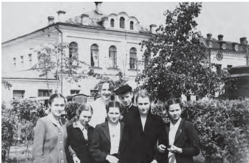
Со школьными друзьями, 8 класс 1955г.