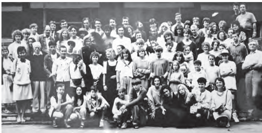
Первый визит детского оркестра из Эксестера в Ярославль, 1990г.