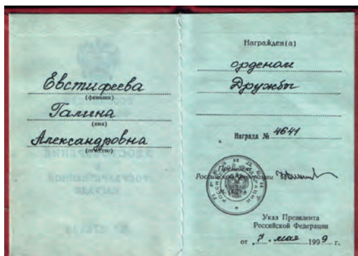
Орден «Дружбы» (награда № 4641), 1999г.