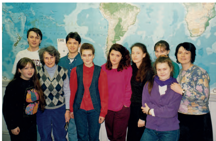
Группа ребят из школы №4 в Норфильд Маунт Хёман (США), 1994г.