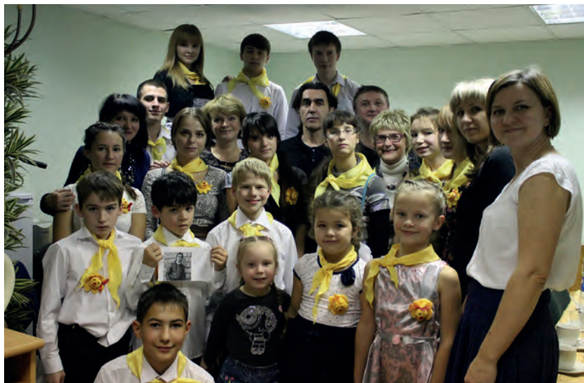
Вячеслав Бутусов в детском доме «Солнечный», 2006 г.