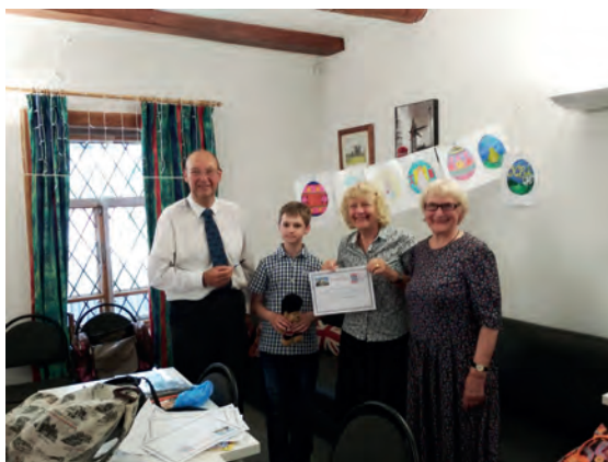
Вручение дипломов участникам творческого конкурса в Ярославле в Эксестер-хаусе (Английском доме), 2018г.