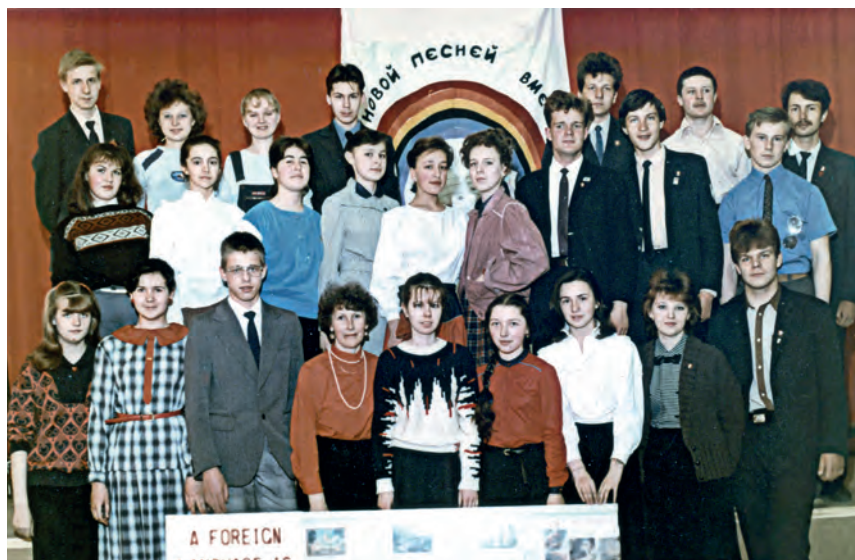
Выпуск 1989 года