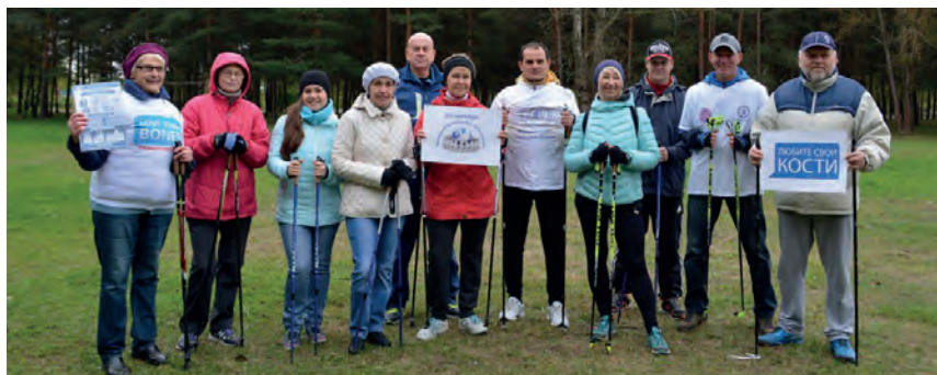
Мастер-класс по скандинавской ходьбе, 2015г.