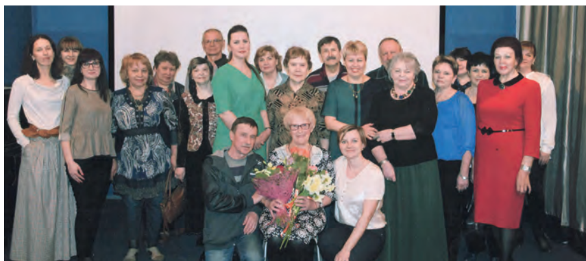
Презентация фильма «Золотое сердце» в Камерном театре Ярославля, 2016г.