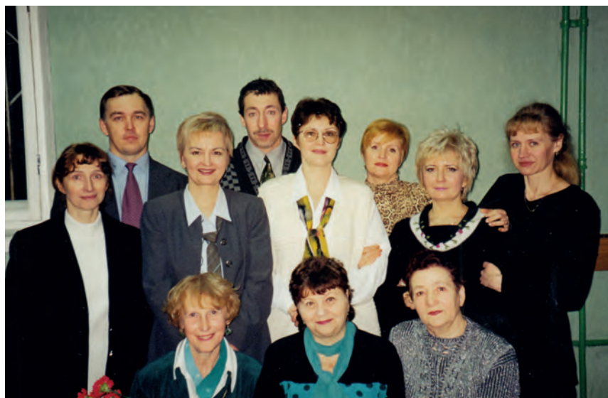
Выпуск 1977 года