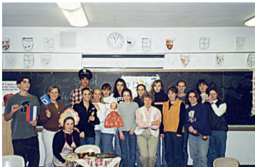
Урок русских традиций в школе Хэмилтон Вэнам, 1998г.