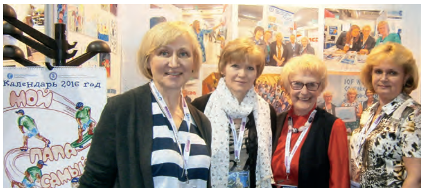
Модуль РАОП и «Остеорус» на Международном конгрессе в Малаге 2016г.