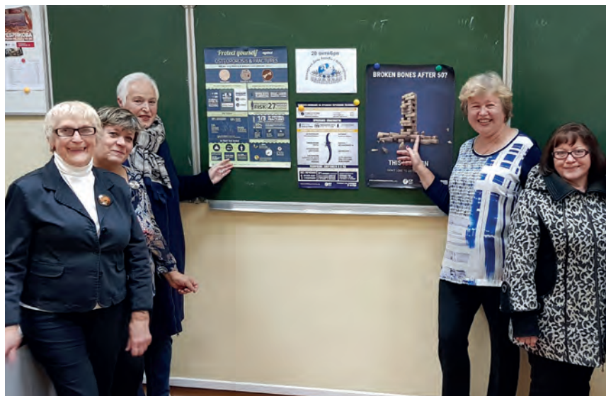
Беседа об остеопорозе в Обществе дружбы «Ярославль-Экстер».