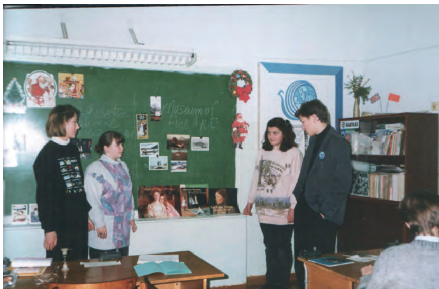
На уроке английского языка в школе №4. 1994 г.