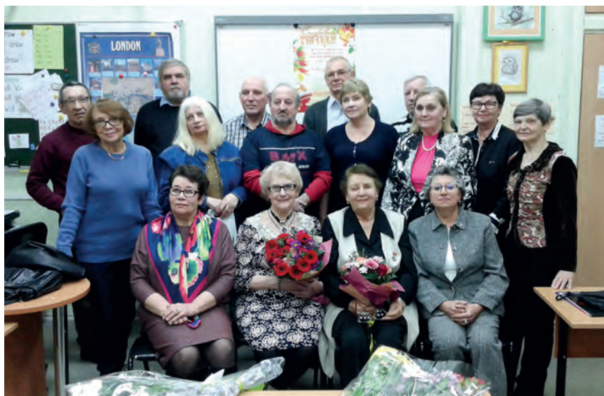
50 лет выпуску 1968 года (2018г)