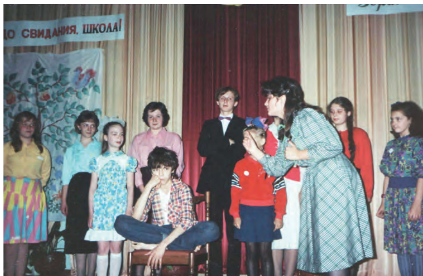
Первый мюзикл «Приключение Гекльберри Финна», 1990г.